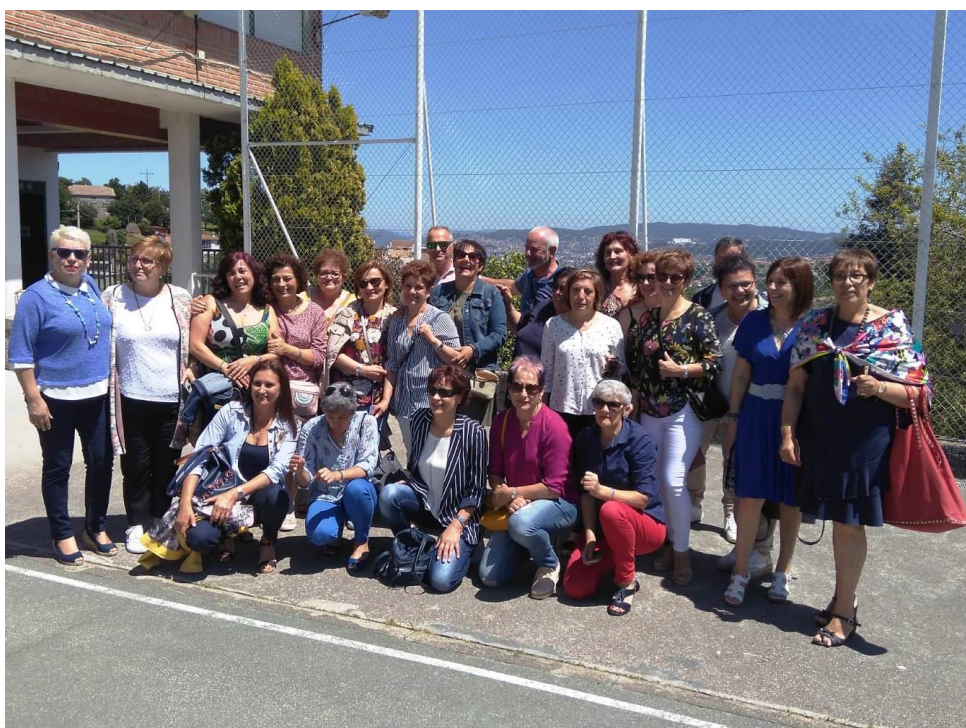
Ex-alumnas@s de Valladares e Zamáns

Despois de varios actos, rematou a xornada cun xantar aberto no que participaron mais de 200 persoas